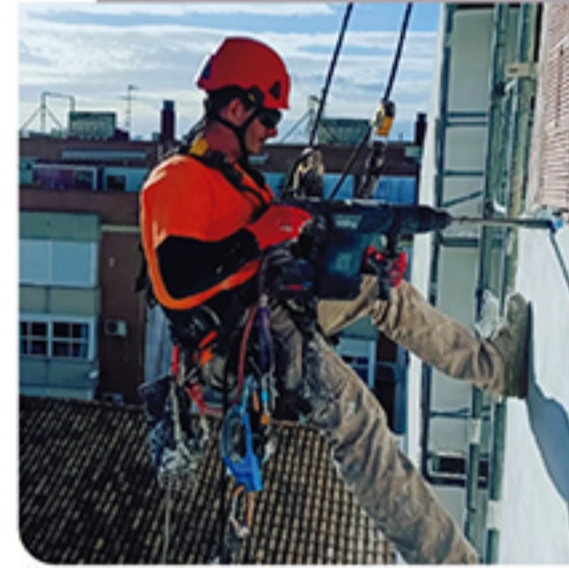
REHABILITACIÓN DE EDIFICIOS