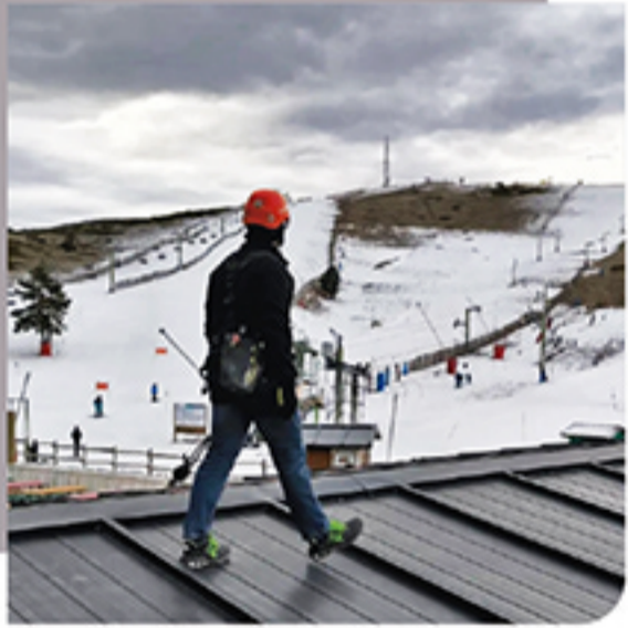
LINEAS DE VIDA